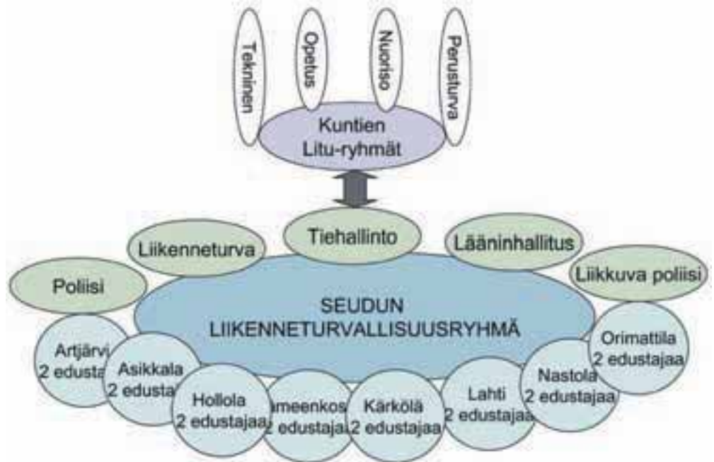
Kuva 10.3-2 Seudullinen liikenneturvallisuustyön organisointi

Kuvassa 10.3-2 on esitelty seudulle kehitetty KVT-työn organisoimismalli. Malleja on käsitelty tarkemmin luvussa 8.7. Etelä Päijät-Hämeen liikenneturvallisuustyöstä vastaavat ensisijaisesti kuntien liikenneturvallisuusryhmät. Seudullisen ryhmän roolina on edistää yhteistyötä hallintokuntien välillä, saada aikaan synergiaa tiedotuksessa ja toiminnassa sekä tukea kuntien työn ideointia, järjestää osaltaan rahoitusta liikenneturvallisuustyölle ja liikenneturvallisuustyön seuranta.